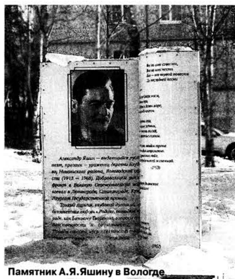
Памятник А.Я. Яшину в Вологде

Им двигала цель обнажить реальные чувства сельских жителей. Однако произведение подверглось жесткой критике в печати. Писали даже, что это серьезный срыв в творчестве Яшина. Но, несмотря на весь негатив, именно этот рассказ стал подготовительным этапом для творчества других прозаиков Ф.Абрамова, В.Белова и С.Залыгина.