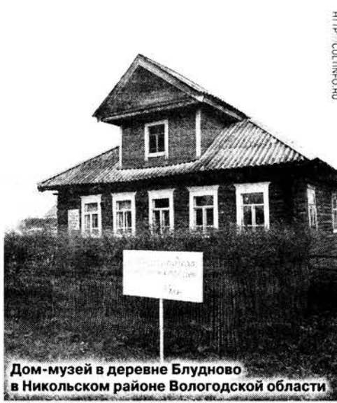
Дом-музей в деревне Блудново в Никольском районе Вологодской области

Александр Яшин пишет и прозу. Так, значимой в советской литературе стала публикация в сборнике «Литературная Москва» рассказа «Рычаги». Там автор выступил против партийного бюрократизма и фальшивой официальности. Писатель не желал видеть руководителей колхозов в роли партийных рычагов в деревне.