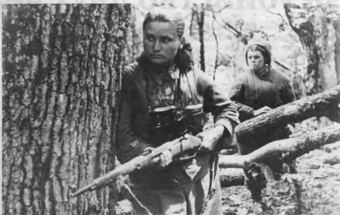
Бойцами партизанских отрядов нередко становились женщины и подростки. Великая Отечественная война действительно была народной.