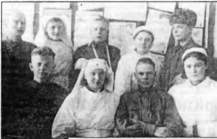
Раненые и медперсонал госпиталя (г. Вытегра)

фронт ушли многие мужчины, но на их рабочие места пришли женщины, старики, подростки. Жизнь в городе не замерла. По Маринской водной системе шла эвакуация людей и отгрузка наиболее ценного оборудования Вытегорстроя, занимавшегося в мирное время реконструкцией Маринской водной системы. На его демонтаж и погрузку мобилизовали многих жителей. Работа шла днем и ночью. Работники Вытегорской пристани не снижали грузоперевозок, занимая по их объемам первые места среди пристаней Шекснинского бассейна. Небольшие предприятия местной промышленности производили не-