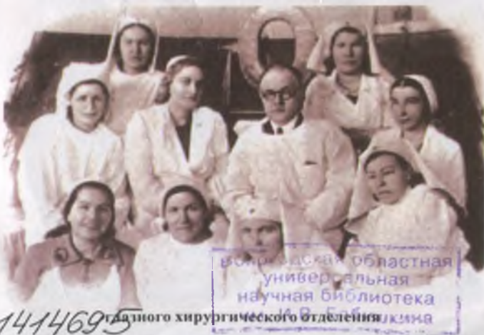
Волгодонская областная универсальная научная библиотека хирургического отделения