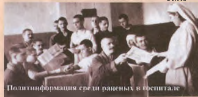
Политинформация среди раненых в госпитале