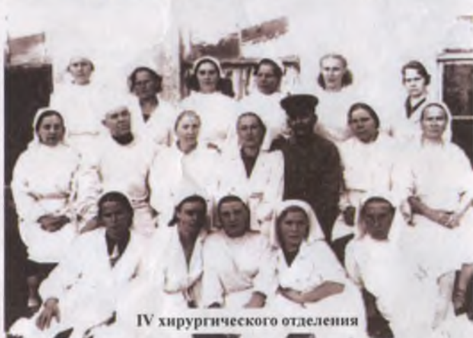
IV хирургического отделения