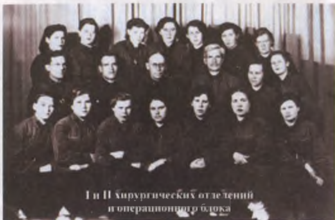
И и II хирургических отделений и операционного блока