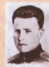
Д.М. Крутиков, Герой Советского Союза