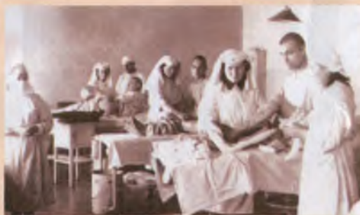
Прием и эвакуация раненых