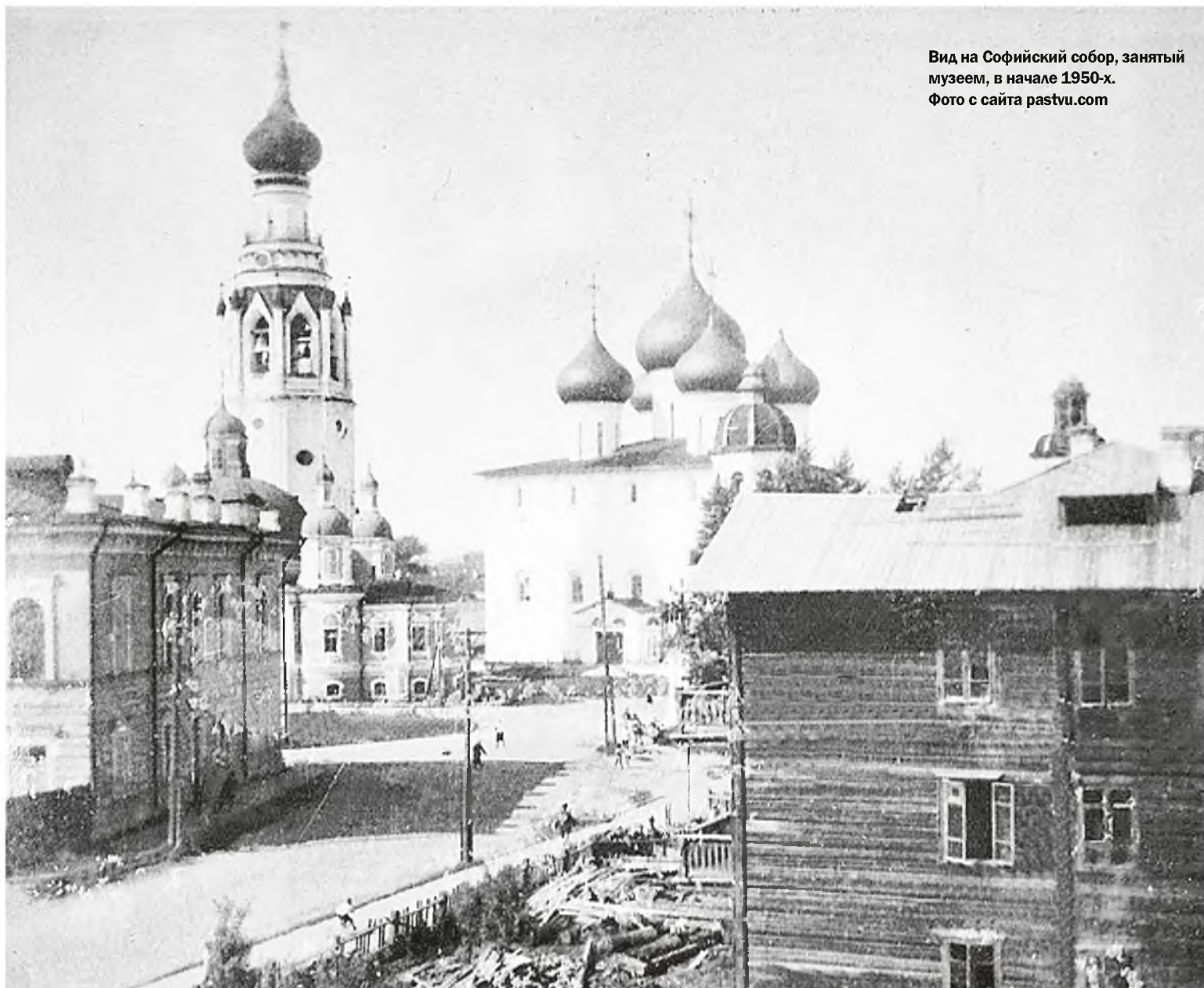
Вид на Софийский собор, занятый музеем, в начале 1950-х.

Вологодский областной краеведческий музей, располагавшийся в Вологодском кремле и в том числе в Софийском соборе, ждало более суровое испытание.