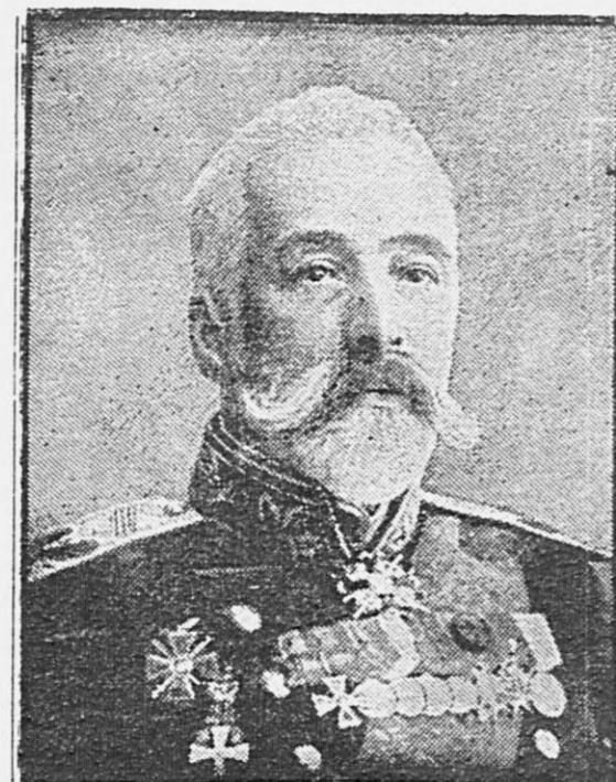
Морской министр адмиралъ И. К. Григоровичъ.

Къ общему кооперативному съѣзду. Сегодня, въ 12 ч. дня, въ помещеніи вологодскаго общества сѣльского хозяйства назначено засѣданіе прѣдлума комитета съѣзда для разсмотрѣнія слѣдующихъ вопросовъ: 1) сообщеніе о ходѣ работъ къ съѣзду; 2) мѣры для ускоренія работъ съѣзда; 3) о привлеченіи докладчиковъ; 4) разработка матеріаловъ (анкеты); 5) смѣта; 6) печатаніе докладовъ; 7) о помещеніяхъ для занятій съѣзда; 8) о квартирахъ и продовольствѣ членовъ; 9) подысканіе платныхъ секре