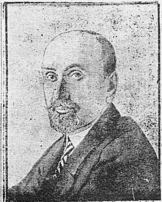
Министръ иностранныхъ дѣлъ С. Д. Сазоновъ