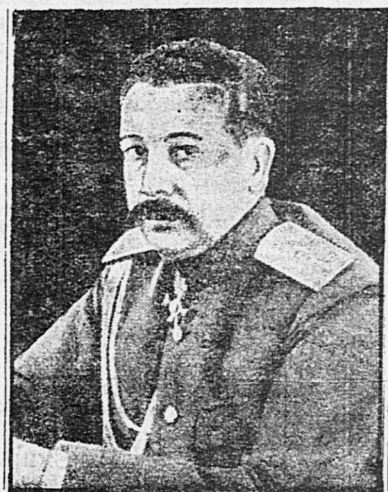
Начальник Штаба Верховного Главнокомандующего генерал Янушев

Собрание рабочих типографского и переплетного дѣла. Сегодня, в 1 часть дня, в помещении о-ва «Прогресс» (Благовѣстская ул., д. Шляроковой), на основании закона 4 марта