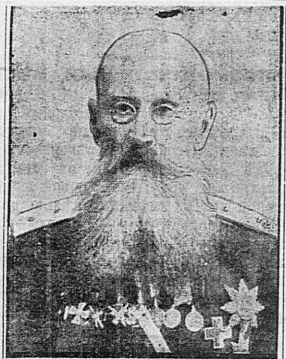
Главнокомандующий армией юго- западного фронта генерал Н. И. Иванов.

телеграмма эта не могла уже быть опублико- вана.