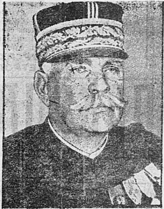
Французскій главнокомандующій ЖОФФРЪ