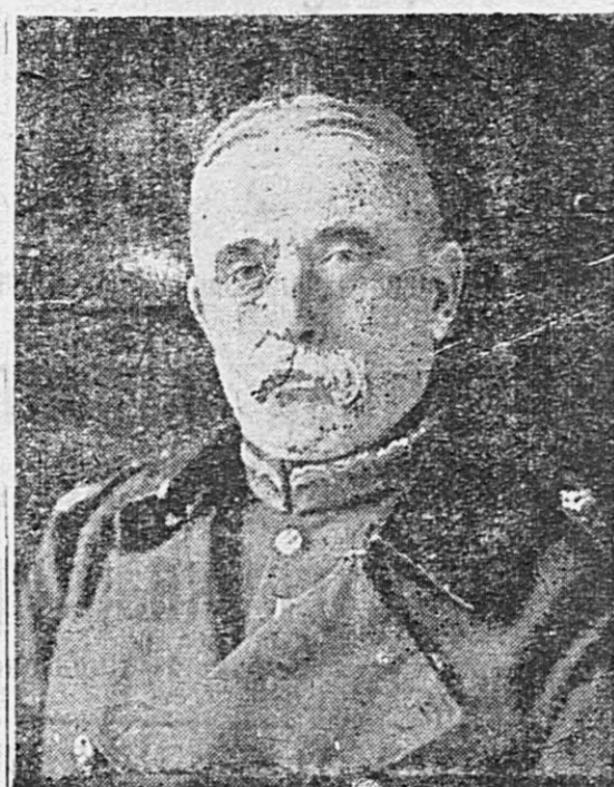
Англійскій главнокомандующій ФРЕНЧЪ