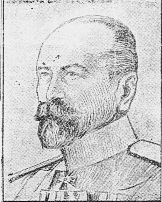
Военный министр генерал от инфантерии А. А. Поливанов

Засѣдание продовольственной комиссии. В четверг, 16 июля, в 8 ч. веч., состоялось очередное засѣдание продовольственной комиссии, на котором, между прочим, постановлено набрать две новые комиссии: одну для разработки мероприятий по борьбе с возрастающей дороговизной квартир и другую по общим вопросам. Последней, между прочим, поручено выработать регламенты самой комиссии.