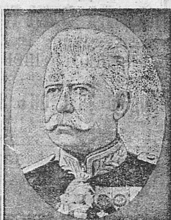
Бельгійскій генералъ ВАЛЛИСЪ