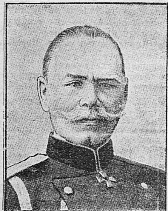
Главнокомандующий армией северо-западного фронта генерал Алексеев.