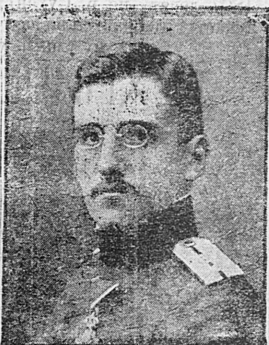
Сербскій главнокомандующій наслѣдній корольевичъ АЛЕКСАНДРЪ