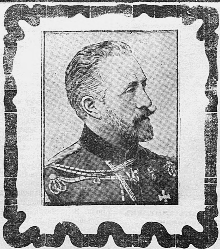
Верховный Главнокомандующий его Императорское Высочество Великий Князь Николай Николаевич.