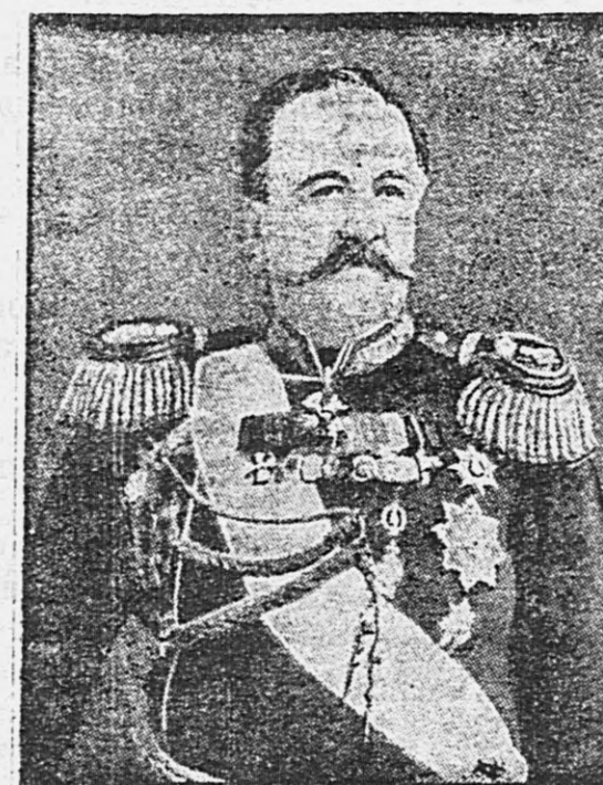
Намѣстникъ Его Величества на Кавказѣ графъ И. И. Воронцовъ Дашковъ.

Собрание общества «Вологжанинъ». 21 июля, во вторникъ, въ 7 час. вечера, въ помещеніи городской управы, состоялось общее собраніе членовъ обще