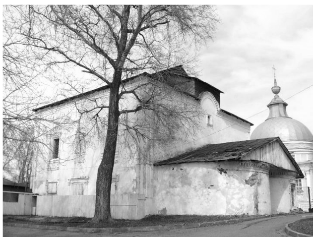
Устьянская Воскресенская церковь