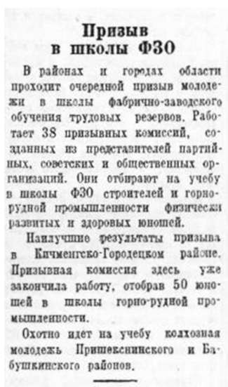
Призыв в школы ФЗО (Красный Север. 1949. № 46. С. 1)

сии!», «Будешь мастером!», «Юноши и девушки! Поможем создать мощные трудовые резервы Советского государства. Поступайте в ремесленные, железнодорожные училища и школы ФЗО!», «Становитесь квалифицированными рабочими социалистической промышленности!» и т.д.