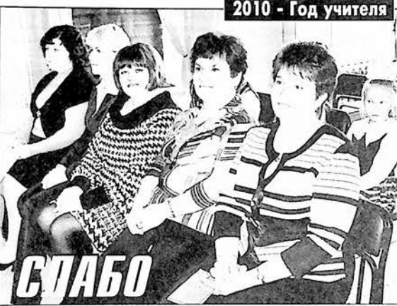
2010 - Год учителя