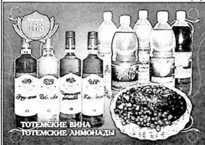
ТОТЕМСКИЕ ВИНА ТОТЕМСКИЕ ЛИМОНАДЫ

Параллельно с производством вин наше предприятие занимается выпуском безалкогольной продукции: «Лимонад», «Барбарис», «Тархун», «Байкал», «Дюшес», «Крем-