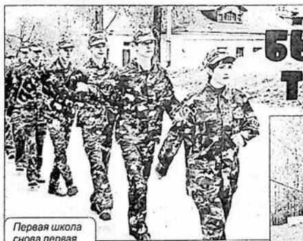
Первая школа снова первая