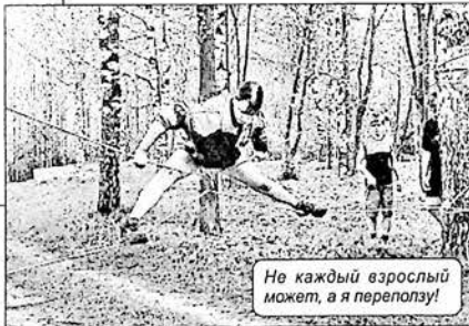
Не каждый взрослый может, а я переползу!

Игра "Зарница" обретает былую популярность среди молодежи. Вместе с тем требования к участникам остаются высокими. Среди конкурсов - туристская полоса, пожарная эстафета, стрельба, военная полоса, дорога безопасности и другие, которые проверяют физические данные, умение подростков выживать в экстремальных ситуациях. Наряду с ними - интеллектуальный турнир, теоретические тесты по медподготовке, пожарной безопасности и ПДД. Ну и, наконец, творческий - конкурс юнармейской песни.