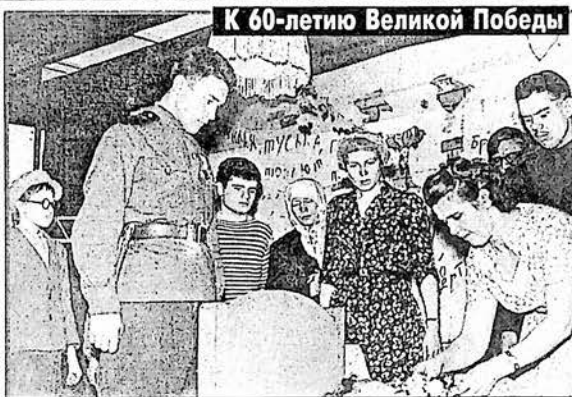
К 60-летию Великой Победы