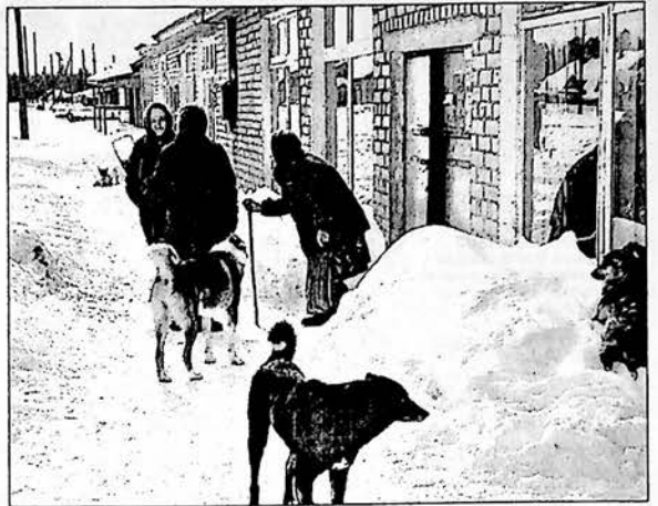
на улице горел, соревнуясь с весенним солнышком. Так уже с января, объяснили сельчане. Линии-то в Карице безхозные, а