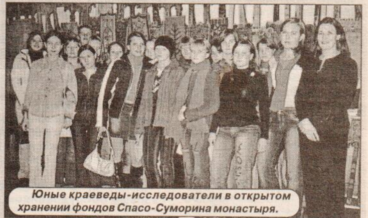
Юные краеведы-исследователи в открытом хранении фондов Спасо-Суморина монастыря.

Ноябрь. Состоялись лагерные сборы юных краеведов – исследователей на базе станции юных туристов. Ребята в три дня учились писать и оформлять доклады, познакомились с историей городов Вологодской области. Побывали в музее Кускова, в фондах Спасо-Суморина монастыря. Получили хороший заряд энергии и новые знания.