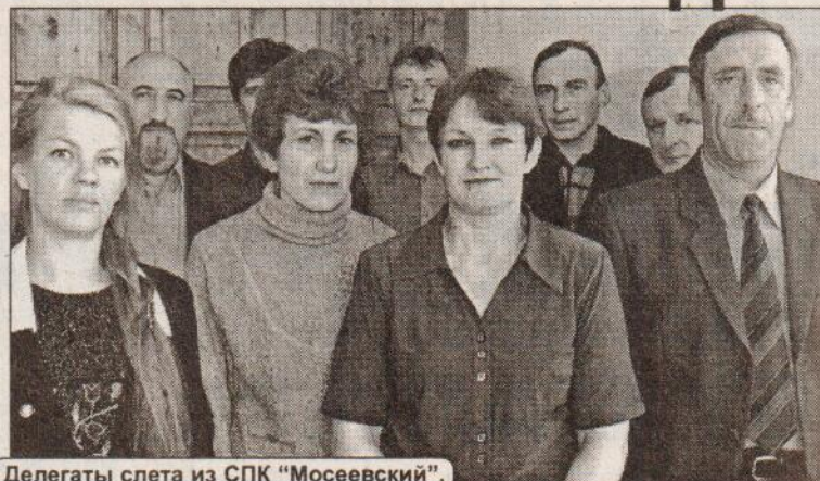
Делегаты слета из СПК «Мосеевский».

- Вот уж истине заслуживают наши аграрники самых добрых