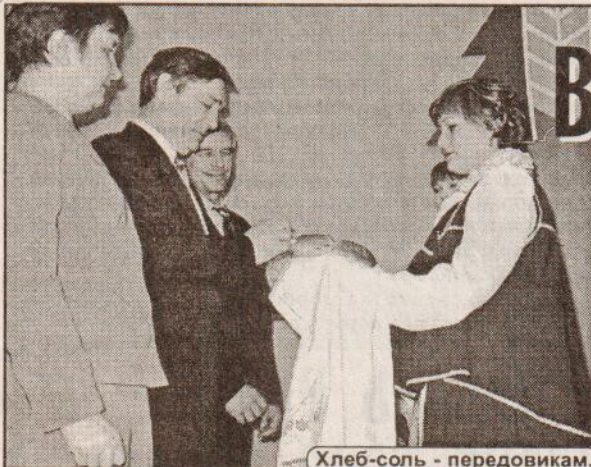
Хлеб-соль - передовикам.

Вчера МЦ «Тотьма» гостеприимно встречал делегатов районного слета передовиков агропромышленного комплекса. В зале собрались самые достойные представители коллективов: животноводы, полеводы, механизаторы, специалисты, руководители. Те, кто приумножает славу не только хозяйства, предприятия, на котором трудится, но и района.