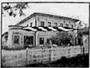
СВИДЕТЕЛЬСТВО РЕГИОН. ИНСПЕКЦИИ (Г. ТВЕРЬ) В Т-0571

Продам «ВАЗ-21073», 1996 г.в. Т. 2-44-54.