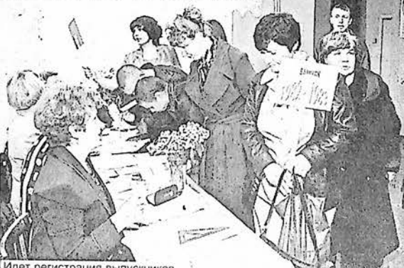
Идет регистрация выпускников.