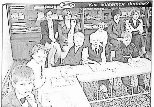
Как живется детям?