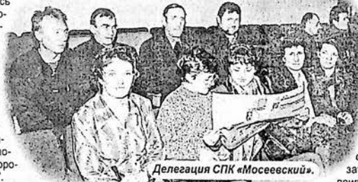
Делегация СПК «Мосеевский».