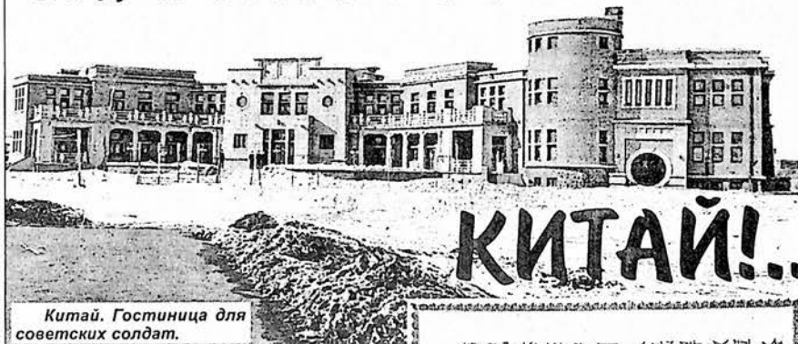
Китай. Гостиница для советских солдат.