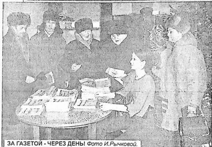
ЗА ГАЗЕТОЙ - ЧЕРЕЗ ДЕНЬ