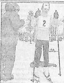
Торжественным построением, мелодией духового оркестра открылись 7 января ставшие уже традиционными двухдневные рождественские гонки на