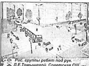
Рис. группы ребят под рук. Л.Б.Томышевой, Советская ГИШ.

отделения ГАИБДД, все по той же теме - «В стране дорожных знаков». Выступления ребят оценивало специально созданное жюри, оно и назвало лучшие коллективы. Первое место заняла агитбригада из Середской общеобразовательной школы,