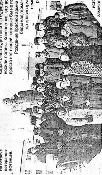
На встрече ветеранов-афганцев.

Рождение Красной армии отмечают 23 февраля в честь ее первой победы над германскими войсками под Нарвой и Псковом, когда красноармейцы в 1918 году дали решительный отпор немцам и остановили их наступление на Петроград. Правда, было это не совсем так. Немцы прорвались на окраины Пскова и вскоре заняли весь город. А за Нарву бой начался в первых числах марта, и ее тоже не удалось отстоять. Немцы объявили большевикам ультиматум, требуя отдать Прибалтику, провести демобилизацию Красной Армии, передать Германии часть флота и золотого запаса России. Ультиматум был принят и в начале марта заключен трагичайший и уникальнейший для России Брестский договор... Такова история. Но она ничуть не умаляет значение этого замечательного праздника, ведь у нашей армии было множество настоящих побед. Этот праздник выражает наше уважение к героям страны, к защитникам нашей Родины от вражеских погнций во все времена. Мы называем его «мужской день» и поздравляем всех - и мальчиков, и пожилых людей.