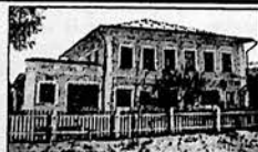
СВИДЕТЕЛЬСТВО РЕГИОН. ИНСПЕКЦИИ (Г. ТВЕРЬ) № Т-0571

в фирме "КУЛЬТОВАРЫ" праздничная торговля: • срисованные открытки, игрушки, • наст. игры, куклы, посудка • машин, автомобили • шашки, шахматы, лото, домино, тир • часы (настенные, настольные, наручные) • КОЛЯСКИ, ДЕТСКИЕ КРЕСЛА, качели, • тележки, велосипеды (взрослые, детские) • гитары, канцтовары, • хозяйственные и рыболовные товары Возможна отсрочка платежа и СКИДКИ г. Вологда, ул. Мудрова, 30 Т. (822) 24-44-60 (ф), 25-63-14 (торг. отд.)