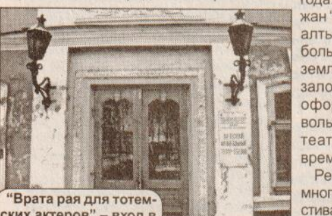
“Врата рая для тотемских актеров” – вход в музыкальный театр в Вологде, за которым родились лауреатами.

Афиши пестрели громкими именами драматургов: Чехов, Арбузов, Горин... Два спектакля – Тарногского и Череповецкого народных театров –