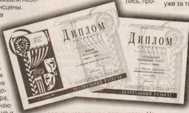
Диплом за создание лучшей женской роли и диплом за создание лучшей мужской роли.

Л. ГОНЧАРОВА, наш корр. и режиссер народного театра МЦ “Тотма”.