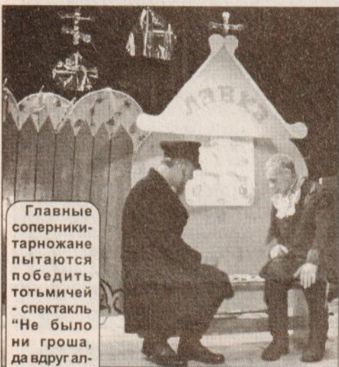
Главные соперники тарножане пытаются победить тотемичей - спектакль “Не было ни гроша, да вдруг алтын”.