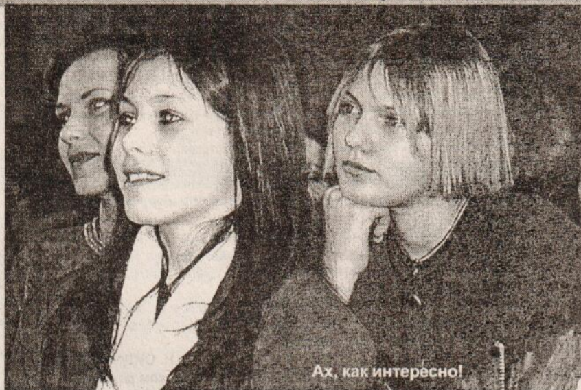
Ах, как интересно!

И каждый час, И каждую минуту О чьих-то судьбах вечная забота, Кусочек сердца отдавая, кому-то – Такая вот учителя работа. Это слова о всех тех, кто сеет "разумное, доброе, вечное". И. РАТУШИНА, учитель литературы.