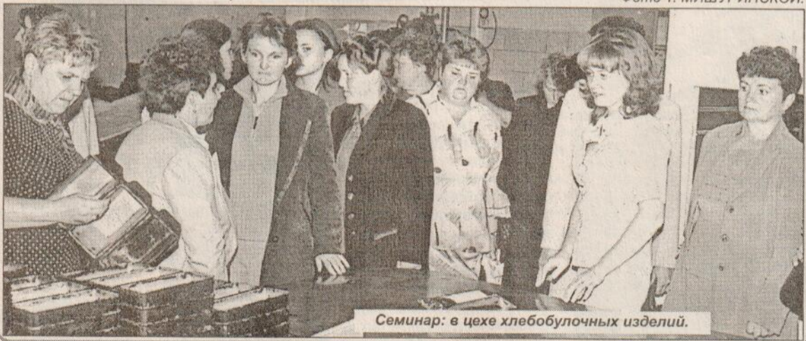
Семинар: в цехе хлебобулочных изделий.