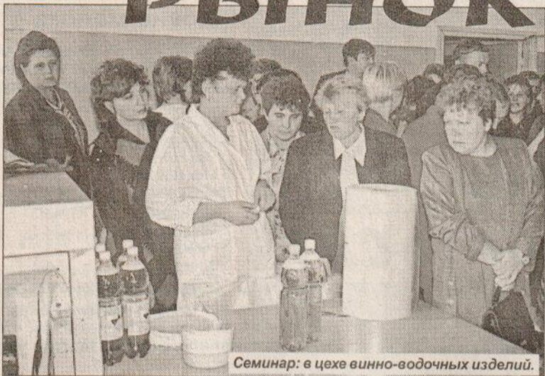
Семинар: в цехе вино-водочных изделий.

хлебобулочных изделий увеличивается на две тонны. Цех выпускает изделия более 20 наименований, из них 16 - мелкоштучных. Большое внимание уделяется качеству выпускаемой продукции. Для этого приглашаем специалистов из ведущих фирм и предприятий области. Словом, делаем все, чтобы удовлетворить спрос нашего покупателя, поскольку в нынешних условиях конкуренции это очень важно.