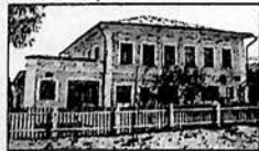
СВИДЕТЕЛЬСТВО РЕГИОН. ИНСПЕКЦИИ (Т. ТВЕРЬ) Т-0571

СПК "Родина" продает автомобильный прицеп "ГКБ-8350", 1988 г.в. Т. 62-5-46, 62-5-41.