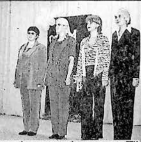
Будущие представляют молодых специалистов ТТУ.