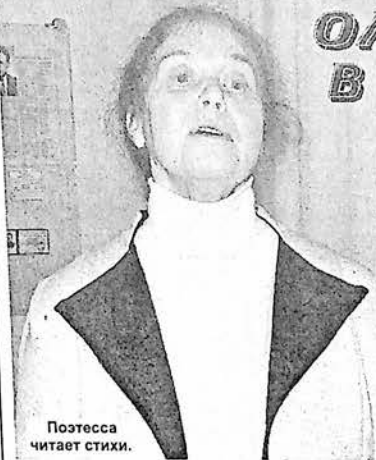
Поэтесса читает стихи.