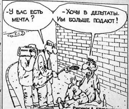
Рисуюнок А. ЕВТУШЕНКО.