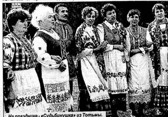
На празднике - «Судьбинушка» из Тотмы.