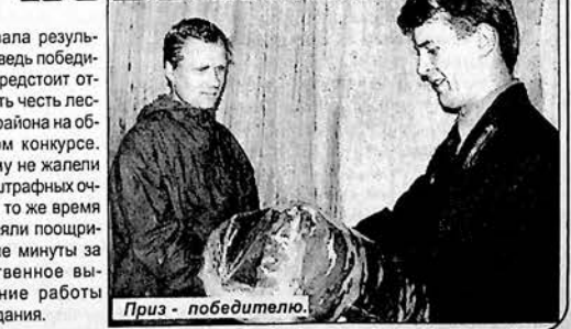
Приз - победителю.