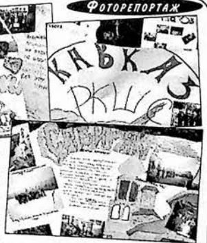
"Школа безопасности": конкурс стенных газет.

Опустел остров. Разве что помятая трава на лугах да пепел от костров напоминают, что еще вчера здесь был разбит палаточный городок. Совсем скоро распрощается с нами лето, и ребята вернутся