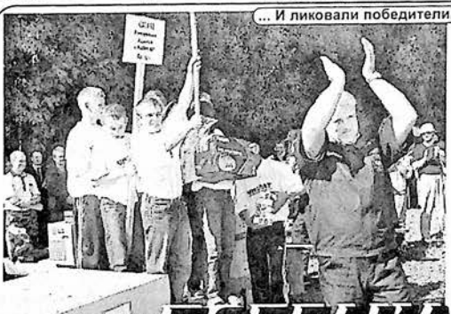
... И ликовали победители.