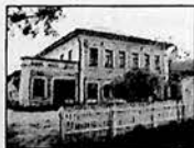
СВИДЕТЕЛЬСТВО РЕГИОН. ИНСПЕКЦИИ (Г. ТВЕРЬ) в Т-0571

Материал подготовили Л. ГОНЧАРОВА, Л. ТРУТНЕВА и Г. АНДРЕЕВА.