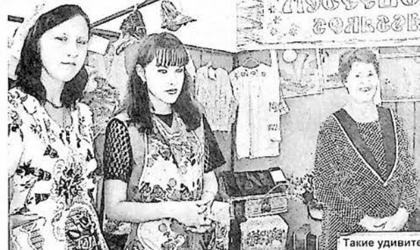
Такие удивительные покусные одеяла шьют