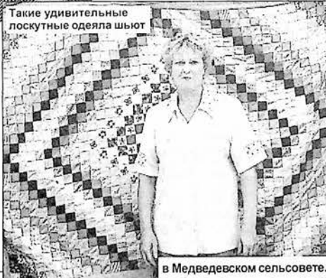
в Медведевском сельсовете.

всей округи и дальних весей, более 600 торговых мест было занято в эти дни. Продавали изделия народных промыслов и трикотаж, товары повседневного спроса и нарядную одежду, посуду и обувь, текстиль и сувениры, продукты питания и напитки. Уйти с ярмарки с пустыми руками было просто невозможно.