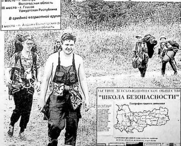
РАЙОННОЕ ДЕТСКО-ЮНОШЕСКОЕ ОБЩЕСТВО "ШКОЛА БЕЗОПАСНОСТИ"

На вечернюю дойку в ООО "Толшменское" мы ехали с конкретной целью - в присутствии специалистов и руководителя составить с животноводом хозяйства откровенный разговор на тему "Так дальше жить и работать нельзя!"