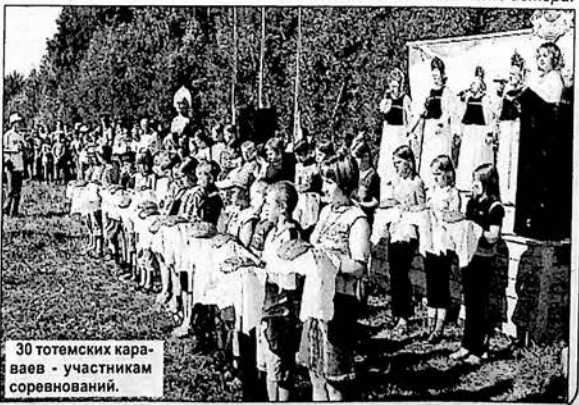
30 тотемских караваев - участников соревнований.