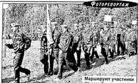
Маршируют участники «Школы безопасности».