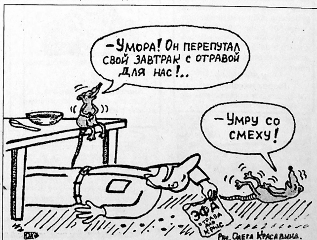
Рис. ОЛЕГА КРАСАВИНА.