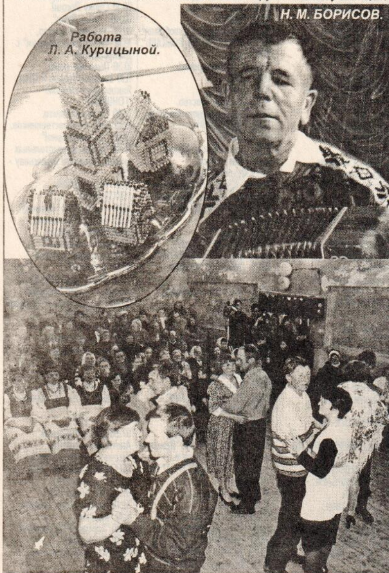
Работа Л. А. Курицыной.

молодым есть что перенять, чему поучиться. Хочется, чтобы такие праздники стали традицией. Они – подтверждение тому, что Россия жива и будет жить, пока есть на древней земле замечательные умельцы, талантливые и находчивые, способные сосуществовать в ладу с природой, брать от нее и возвращать ей сторицей.