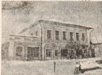
СВИДЕТЕЛЬСТВО РЕГИОН. ИНСПЕКЦИИ (Г. ТВЕРЬ)