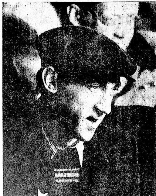
Ну кто не помнит Глеба Жеглова из фильма «Место встречи изменить нельзя» в блестящем исполнении В. ВЫСОЦКОГО? Сегодня ему исполнилось бы 62 года...