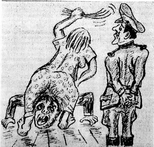
Рис. В. ДУРОВА.

Начало в 19.30. Цена билета — 10 руб. (Цена в № 50 «ТВ» указана ошибочно).