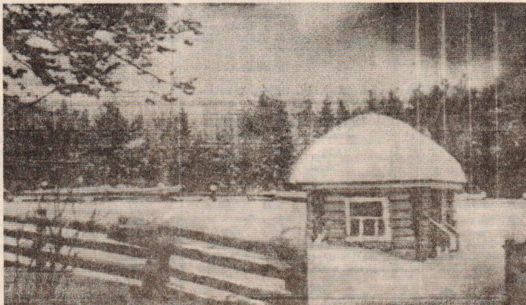
«У ЛЕСА НА ОПУШКЕ ЖИЛА ЗИМА В ИЗБУШКЕ...»