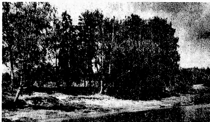
ОСЕННЯЯ ПОРА, ОЧЕИ ОЧАРОВАНЬЕ...

Вас ждут в любом отделении связи и в редакции газеты. Вы сможете выписать «районку» на любой период — от одного до трех месяцев и на полгода.