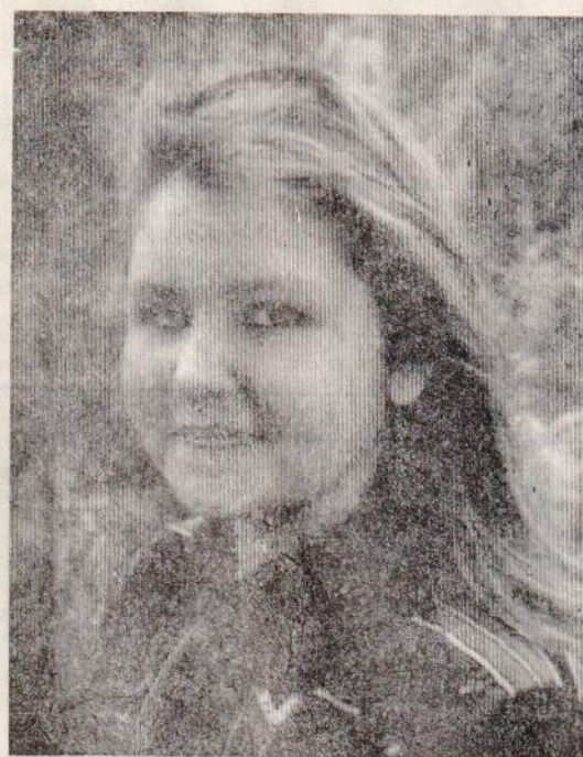
Из серии «ЮНЫЕ ТОТЬМИЧИ».

С травмой лица в приемный покой районной больницы обращался гражданин Н. из пос. Камчуга.