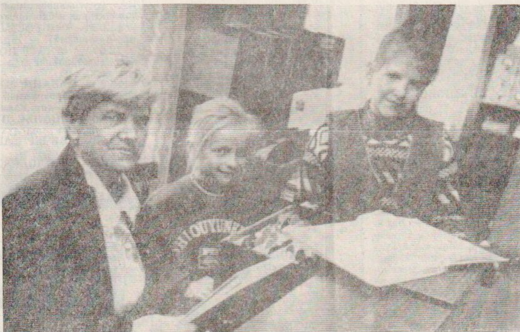
СЮДА НЕ ЗАРАСТЕТ НАРОДНАЯ ТРОПА (в детской библиотеке).

руководитель Рубцовского центра (Санкт-Петербургское отделение).