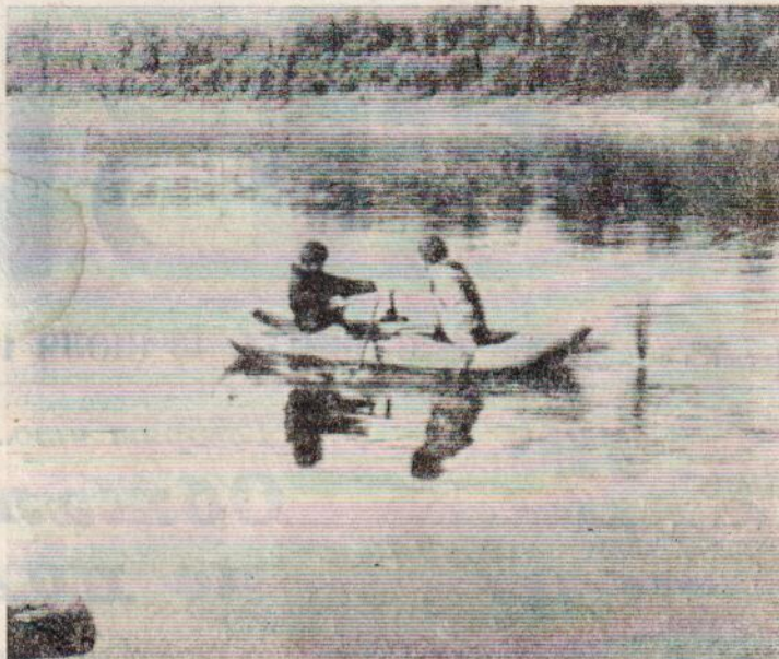
ЛОВИСЬ РЫБКА, БОЛЬШАЯ И МАЛАЯ...

АНОНИМНОСТЬ ВАШЕГО ЗВОНКА ГАРАНТИРУЕТСЯ. ЛЮБЫЕ СООБЩЕННЫЕ ФАКТЫ ПРОВЕРЯЮТСЯ.