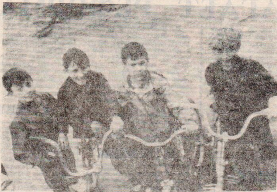
«ОСЕНЬ ДЛИННАЯ. ЕЩЕ ПОКАТАЕМСЯ...».