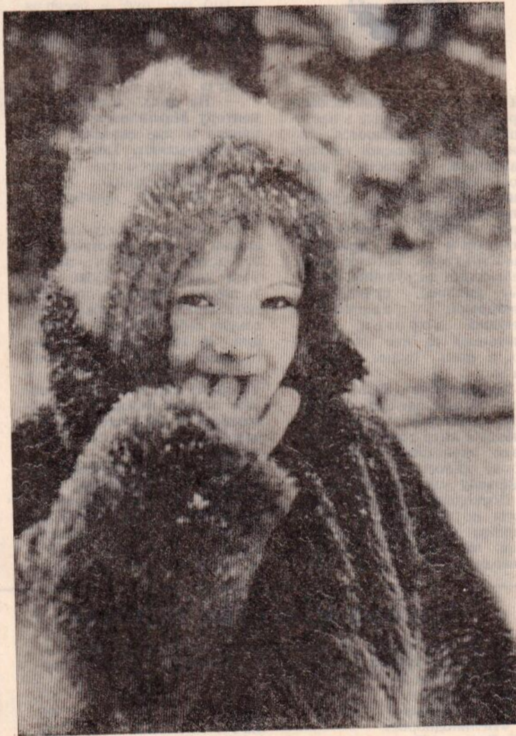
МАЛЫШ УЖ ПОМОРОЗИЛ ПАЛЦЫ...

Мой бигль хотя и мал, Шакала он догнал. Хорошее чутье Его не подвело. И думать он умеет, Хотя не говорит. Вы заведите песика, Порода его бигль.