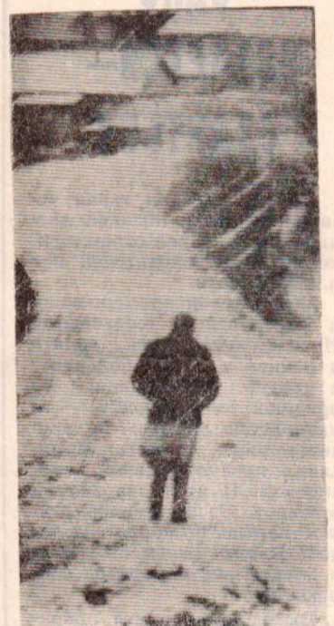
И непогода не держит.

АО «СУХОНСКИЙ ЛЕСПРОМХОЗ» продолжает РАСПРОДАЖУ Ж/БЕ-ТОННЫХ ИЗДЕЛИЙ от комплекта 54-кв. жилого панельного дома. За справками обращаться по телефону 2-16-37.