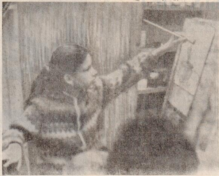
В МАСТЕРСКОЙ ХУДОЖНИКА.

ПРОДАЕТСЯ дача (недорого). Тел. 2-20-39.