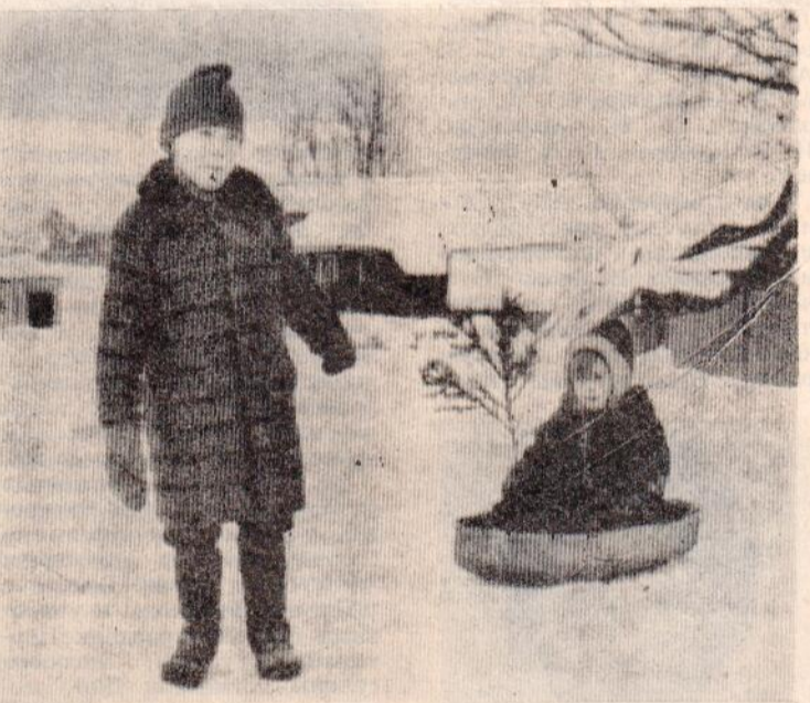
КРАСИВАЯ, ПОЕХАЛИ КАТАТЬСЯ...