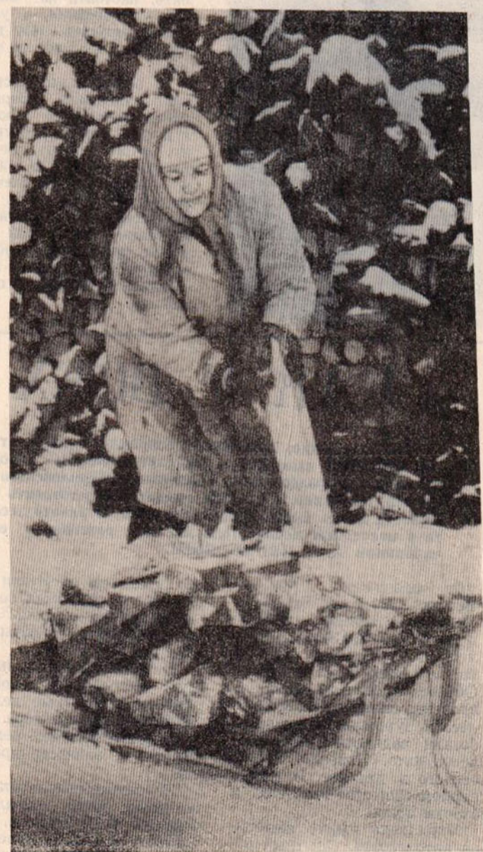
НА СЕБЯ НАДЕЖДА...