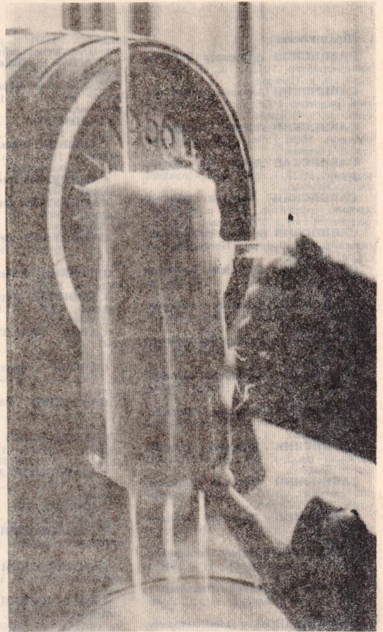
АХ, БЫЛИ ВРЕМЕНА...

АО «ТОТЕМСКИЙ ЛЕСПРОМХОЗ» на постоянную работу требуются ВОДИТЕЛИ категории «Е», ТРАКТОРИСТЫ на «Кировец», ИНЖЕНЕР-ТЕХНОЛОГ ПО ЛЕСОЗАГОТОВКАМ (желательно мужчина). Обращаться в отдел кадров леспромхоза.