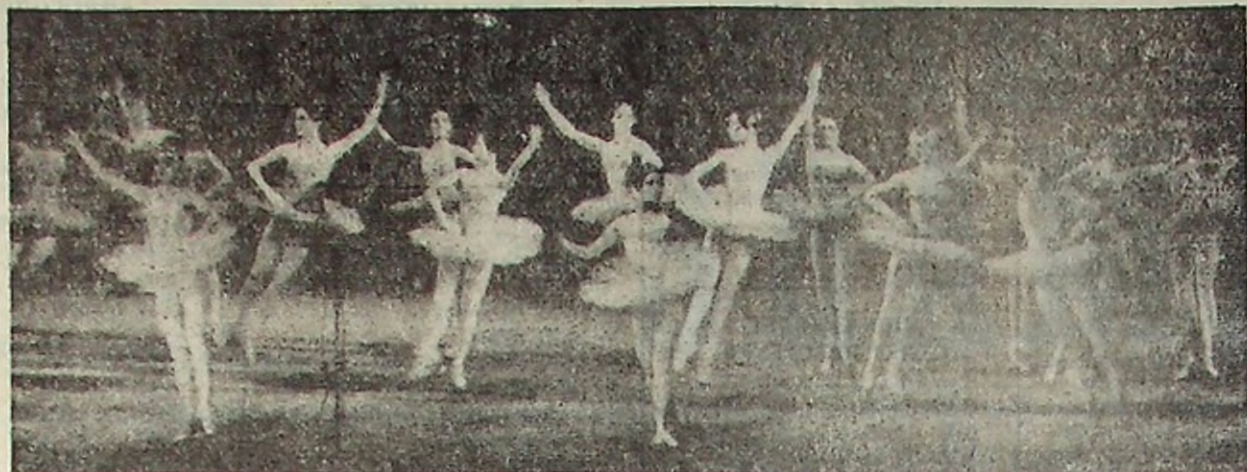
Вот бы у нас, в Тотме, такое увидеть...