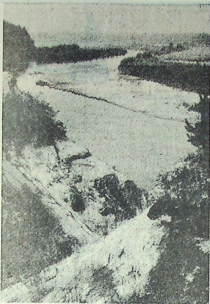
Родные просторы...