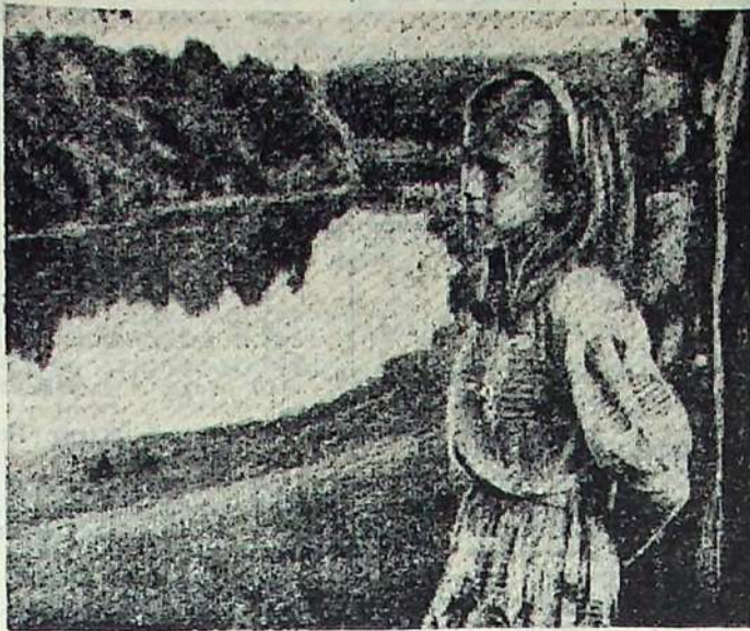
Воспоминание о лете.