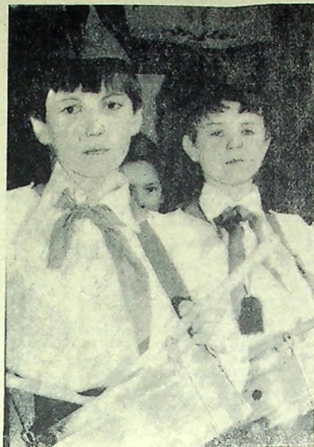
НА СНИМКЕ: юные барабанщицы средней школы № 2.